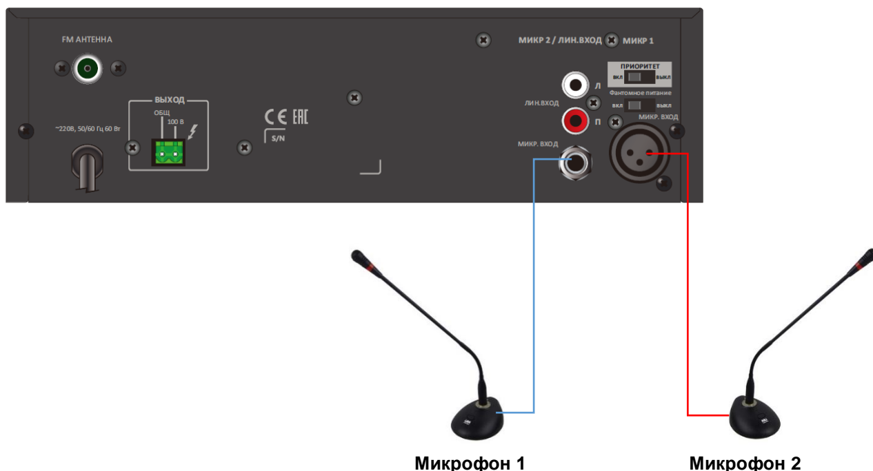
Рис. 2.1. Пример подключения

Перед подключением микрофона выставите регуляторы уровня входа и уровня выходного сигнала на минимальные значения для избежание перегрузки и выхода оборудования из строя.