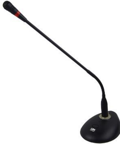
Рис. 1.1. LPA-MIC1

Микрофон настольный конденсаторный предназначена для работы в системе оповещения и музыкальной трансляции. Микрофон обеспечивает передачу голосового сообщения. Микрофон может питаться как от батарей, так и от центрального оборудования (фантомное питание).